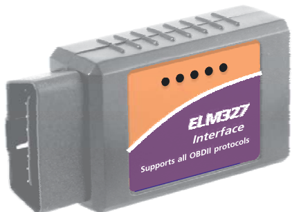
ELM 327 Wi-Fi