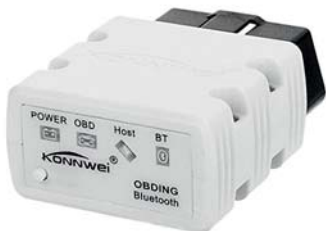
KONNWEI KW902 - Wi-Fi