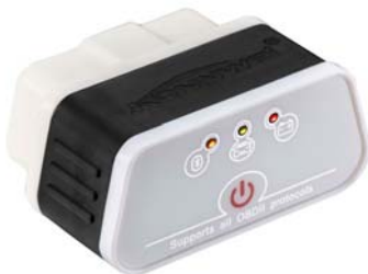
KONNWEI KW903 - Wi-Fi