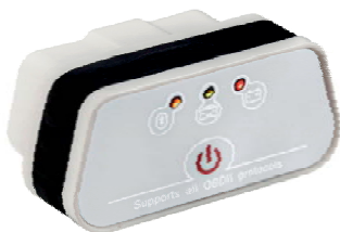
KONNWEI KW901 - Wi-Fi